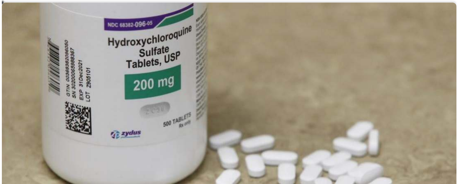
In Italy, the Council of State says YES to hydroxychloroquine as a treatment for Covid-19

🕒 Publié le 11/12/2020 à 14:55 - Mise à jour à 17:11